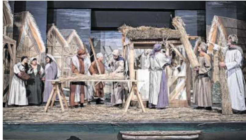
Buntes Leben zur Zeit von Christi Geburt: Stellprobe für das neue Musiktheaterprojekt „Das Wunder von Bethlehem“ im Kurhaus von Bad Hindelang.

Über Jahre reifte in ihr immer mehr die Vorstellung. „Diese Geschichte will und muss klingen“, wurde der Initiatorin zunehmend klarer. Doch zunächst drängte sich ein anderes Projekt in den Vordergrund: „Stille Nacht – die Entstehungsgeschichte eines Liedes“, das