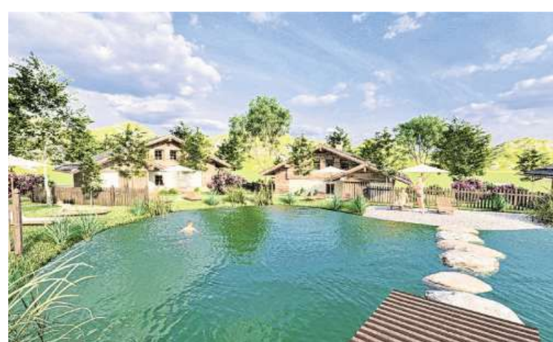
So sollen die Chalets und der Badeteich angrenzend an das bestehende Vitalhotel Mittelburg in Oy-Mittelberg aussehen.

Die Chalets bieten die Möglichkeit, den Betrieb zu erweitern, ohne dem Bestand die Sicht zu verbauen, erklärt Mayr. Die gestiegene Ertragskraft schaffe sodann die