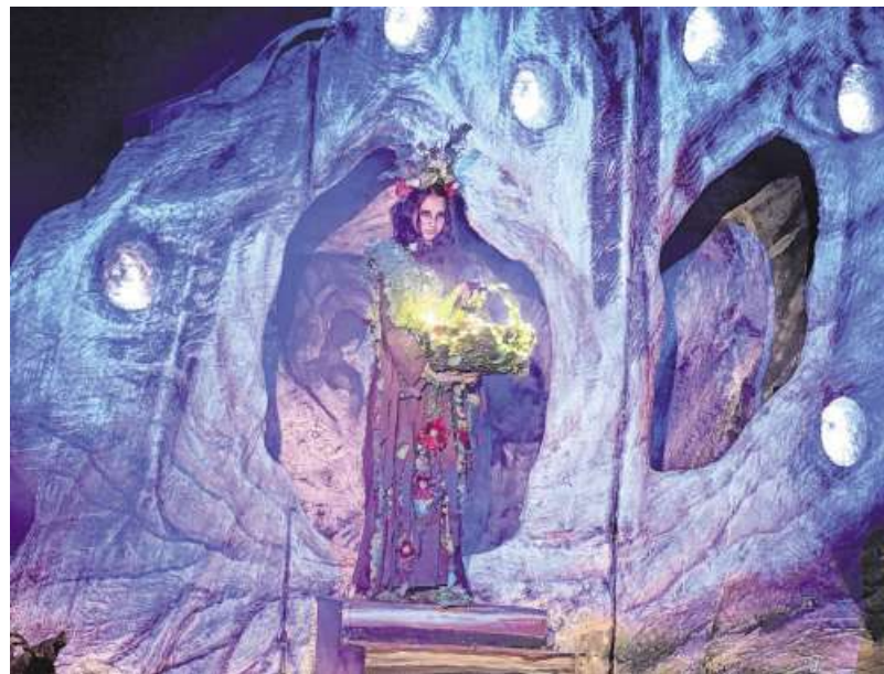
Auch eine Geschichte über die Wildfräulein ist im Hirtenadvent zu erleben.

In der ersten Geschichte „Die Hirten und die magische Höhle“ machen sich drei Jungen aus Hinterstein – der unsichere Bene, der